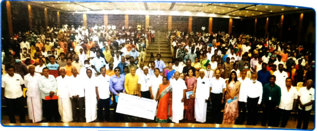
கல்வி உதவித்தொகை பெற்றவர் - 6,824

என்னுடைய அப்பா இறந்துவிட்டார், அம்மா தினக்கூலி வேலை செய்து என்னைப் படிக்க வைத்தார். காட்டாடி அடுத்த பிரம்மபுரம் அரசு மேல்நிலைப் பள்ளியில் 12-ஆம் வகுப்பில் 774 மதிப்பெண்கள் பெற்றுத் தேர்ச்சிப் பெற்றேன். நான் வேலூரில் உள்ள ஊரீசு கல்லூரியில் B.Sc., Computer Science பாடப்பிரிவில் சேர்ந்தேன். அனைவர்க்கும் உயர்கல்வி அறக்கட்டளையில் உயர்கல்வி பயில் உதவித்தொகை பெற்று படிப்பு முடித்தேன். நான் படித்த 3 ஆண்டுகளுக்கும் உதவித்தொகை வழங்கினார்கள். என்னுடைய குடும்பத்தில் நான் முதல்தலைமுறைப் பட்டதாரி. படிப்பு முடித்து இப்பொழுது காட்டாடியில் உள்ள விஜய பல்கலைக்கழகத்தில் Physical Education Department-இல் Gym Instructor-ஆகப் பணிபுரிகிறேன். என்னுடைய உயர்கல்விக்கு மனமார்ந்த நன்றியைத் தெரிவித்துக் கொள்கிறேன்.