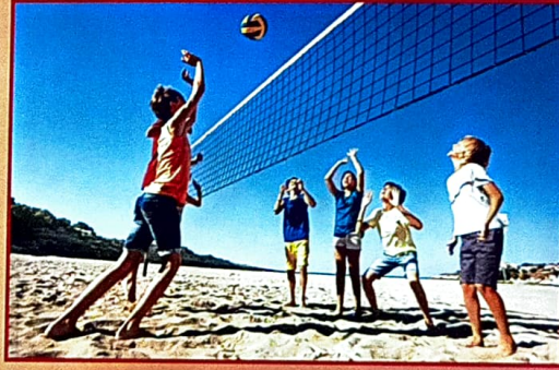
கடற்கரை கையந்து பந்து