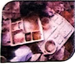
பிளாஸ்டிக் தட்டுகள், கப்புகள்